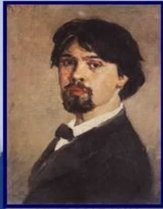
ХУДОЖНИК В. И. Суриков