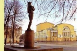
Театр имени Ф. Г. Волкова