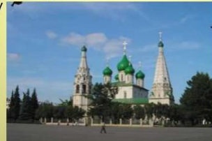
Церковь Ильи Пророка