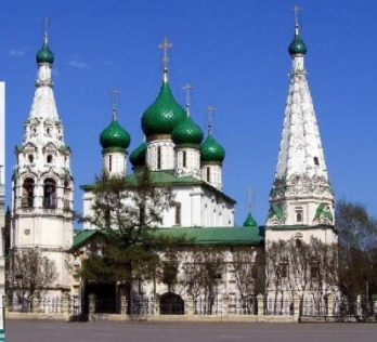
Церковь Ильи Пророка