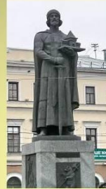
Памятник Ярославу Мудрому