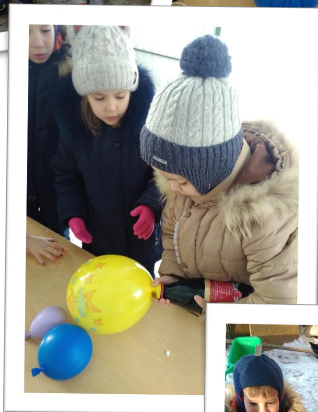
Замораживаем в морозную погоду