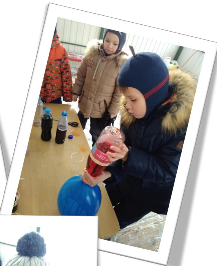
Наливаем в шарики воду