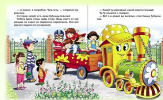
Чтение сказок, рассказов