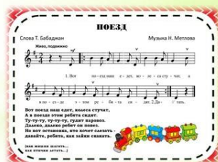
Песня и танец