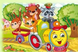
Музыкальные произведения, аудиосказки